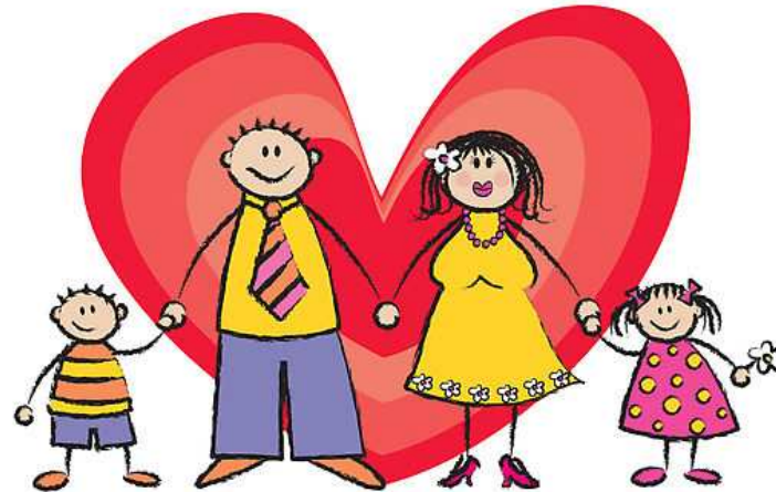
ผู้ออกแบบและจัดทำ : น.ส.จันทิมา นิสสัยสุข (ผู้ช่วยเจ้าหน้าที่บันทึกข้อมูล)