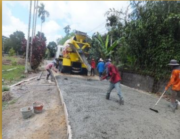
โครงการก่อสร้างถนน ทดล. ขนาดหน้า 4 หมู่ที่ 2