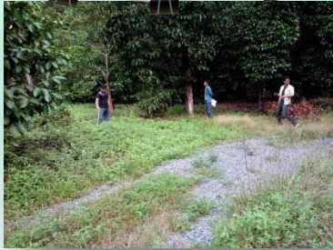
โครงการบูรณาการปะปนน้ำมาดาก หมู่ 3 บ้านผู้ใหญ่ร่าเริง