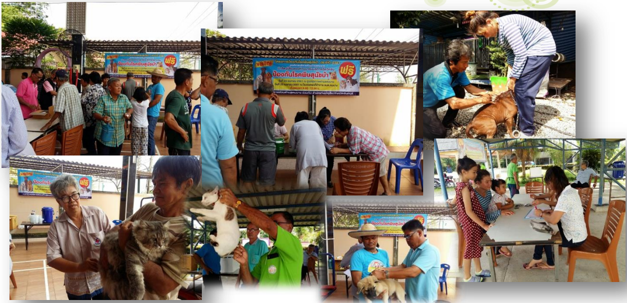
องค์กรบริหารส่วนตำบลมบางร่วมกับสำนักงานปศุสัตว์จังหวัดจันทบุรีและ เจ้าหน้าที่ อสม.ตำบลมบาง ออกให้บริการฉีดวัคซีนป้องกันโรคพิษสุนัขบ้า ให้กับหมาและแมวของชาวบ้านตำบลมบาง โดยออกให้บริการเมื่อวันที่ 24 และ 25 เมษายน 2561 บริเวณศูนย์สุขภาพตำบลมบางและบริเวณโรงพยาบาล อสม.ตำบลมบาง