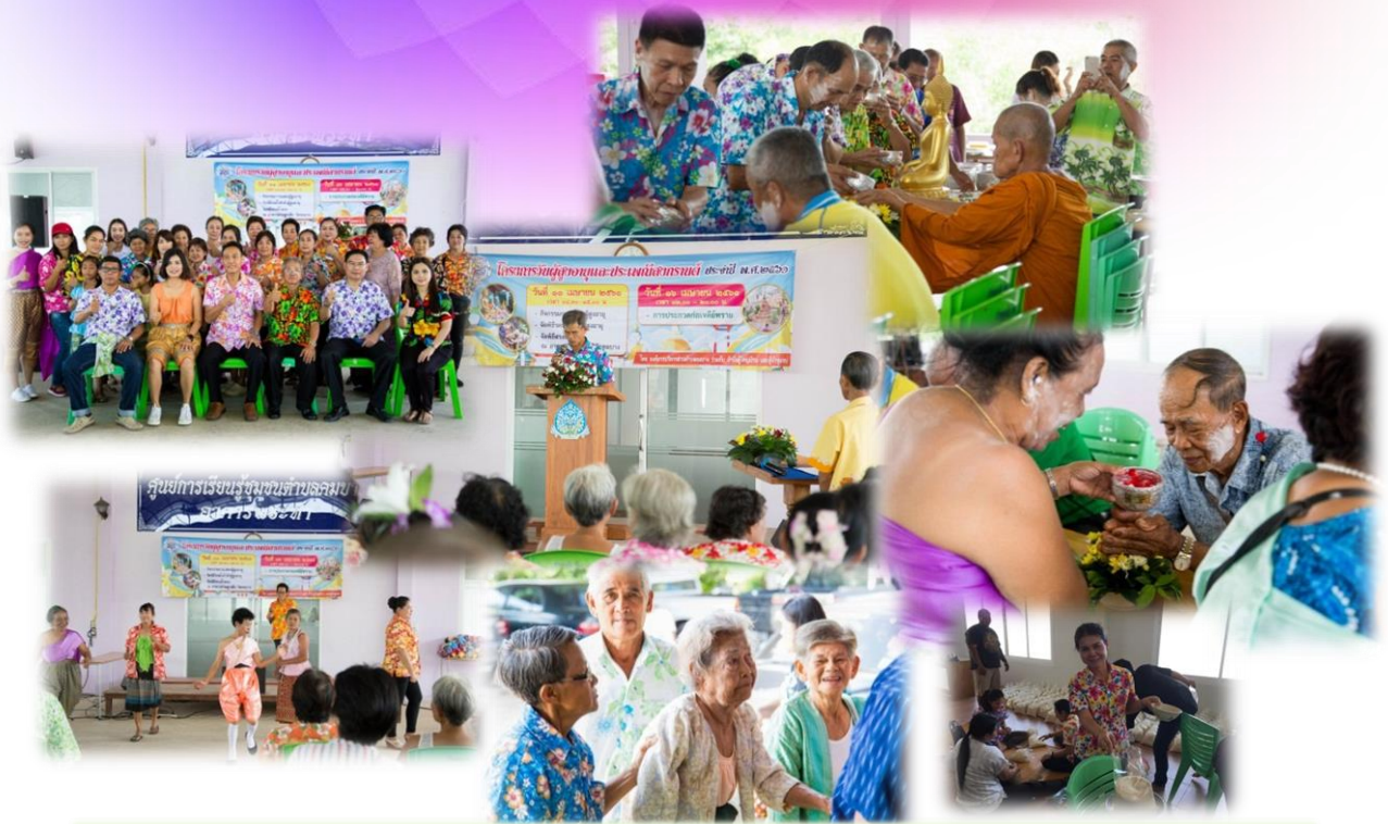
องค์กรบริหารส่วนตำบลมบางร่วมกับผู้นำหมู่บ้านและชมรม ผู้สูงอายุได้จัดโครงการวันผู้สูงอายุและวันสงกรานต์ เมื่อวันที่ 11 เมษายน 2561 บริเวณศูนย์การเรือนรัฐชุมชนตำบลมบาง อําเภอพระภัก